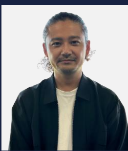
ユナイテッドアローズ