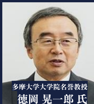
多摩大学大学院名誉教授