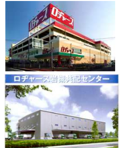
ロヂャース岩槻共配センター