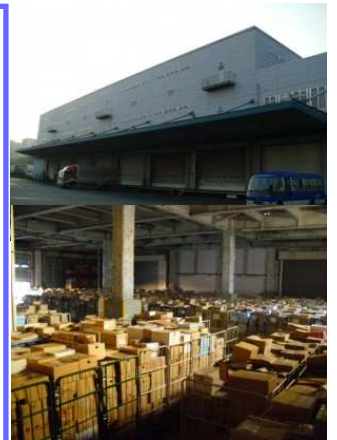
2013年TBSテレビの がっちりマンデーでも 謎の巨大倉庫として取材 されています!!