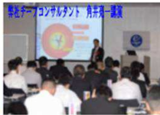
株式会社ニブコンサルタンツへの様子