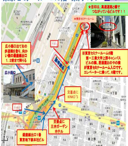
東京セミナールーム6階 案内マップ e-LogiT.com