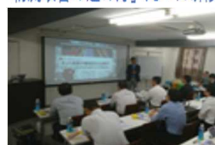
物流改善の進め方」丸1日研修