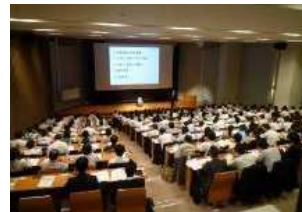
戦略物流セミナー